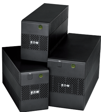
ИБП серии 5E