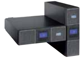
ИБП Eaton 5PX