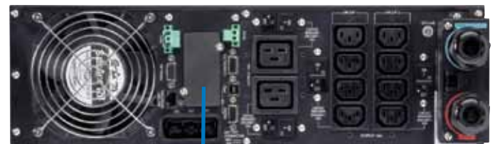
ИБП Eaton 9PX с сетевой картой Network Card-MS (внизу)