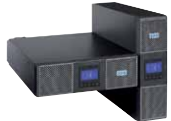
ИБП Eaton 9PX

Все модели поставляются с Network Card-MS и комплектом креплений для монтажа в 19" стойки. ИБП 9PX мощностью 8000 ВА и 11000 ВА стандартно комплектуются внешним сервисным байпасом.