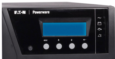
ЖК-дисплей с поддержкой русского языка