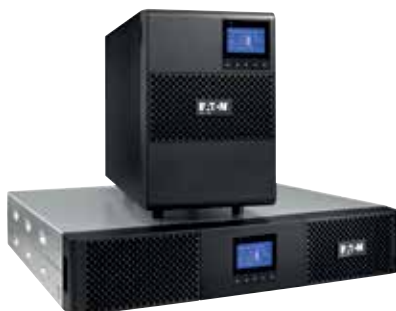
9SX модели стойка и башня