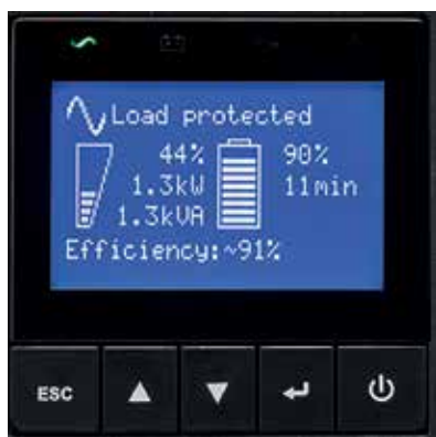
9SX графический ЖК-дисплей