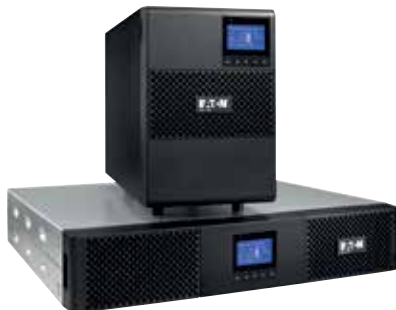
9SX модели стойка и башня