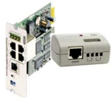
Рис. 3 Опции: адаптер Web/SNMP и Датчик параметров окружающей среды для измерения уровня температуры внешних батарейных шкафов и стеллажей.

датчиком, расположенным внутри ИБП. Эта функция называется температурной компенсацией и позволяет продлить срок службы батарей. В случае если ИБП и внешние батареи находятся в разных помещениях, для температурной компенсации заряда внешнего батарейного модуля можно использовать датчик параметров окружающей среды, который измеряет температуру помещения, где стоит батарейный блок, и Web/SNMP адаптер, передающий измерения от датчика в процессор ИБП.