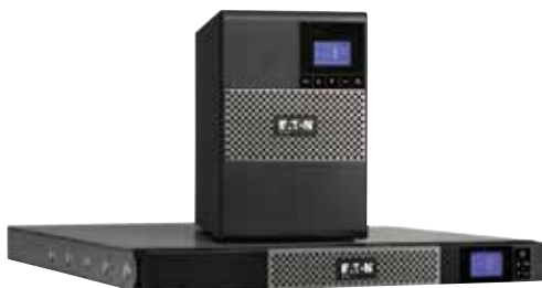
Исполнения Башня и Стойка 1U