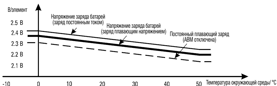
Рис. 2 Температурная компенсация заряда в диапазоне от 0 до +50 °С.

Для удобства пользователя в источниках, где используется АВМ, предусмотрена возможность отключения функции заряда батарей по этой технологии. При этом заряд батарей производится традиционным методом. Режим «заряд по технологии АВМ» установлен в этих источниках по умолчанию. Уровень напряжения при заряде как внутренних, так и внешних батарей регулируется в зависимости от температуры, которая измеряется