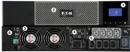
Eaton 5PX 3000i RT2U