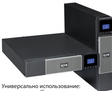
Универсально использование: для стоек/башенное