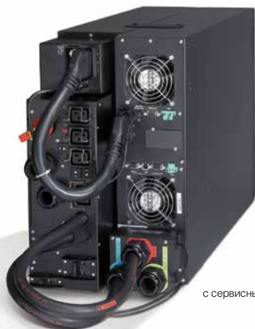
9PX 11 кВА с сервисным байпасом.

ЖК-дисплей 9PX наклоняется под углом до 45° для обеспечения более удобного просмотра